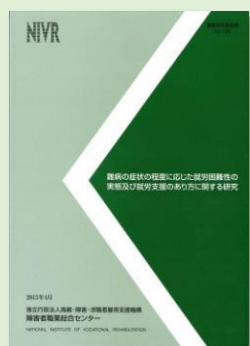
障害者職業総合センター 調査研究報告書